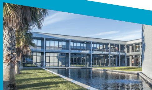
LE FORUM, Pérols Aéroport

Promoteur et gestionnaire d'habitations, de bureaux et de locaux commerciaux au Canada depuis 1974, LE GROUPE DENUX est présent en Languedoc-Roussillon depuis 1996 par sa filiale SM SERVICES spécialisée dans la gestion de bureaux.