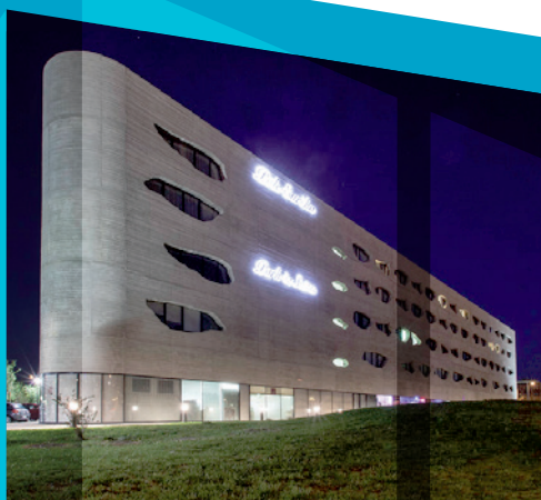
PÔLE EURÊKA, Montpellier Eurêka