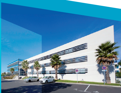
LE GÉNÉSIS, Montpellier Eurêka